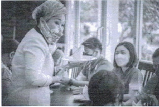
วันที่ ๑๓ มกราคม ๒๕๖๕ ณ อาคารที่พักนักท่องเที่ยวบึงบอระเพ็ด